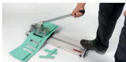
COUPON CUTTER 500 Livré dans sa caisse de transport Réf. 161.540